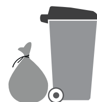
bac ou sac d'ordures ménagères