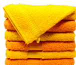
Linges de maison (sauf couvertures)