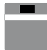
conteneur d'apport volontaire

Déchets d'hygiène (mouchoirs, essuie-tout, couches...), mégots de cigarette, boîtes à fromage en bois, objets en plastique (non électriques), restes alimentaires non consommables, etc.