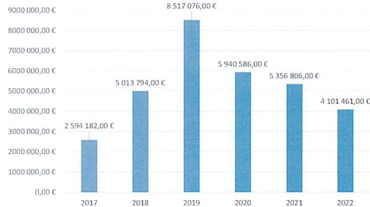
Total dépenses d'équipement (restes à réaliser compris)