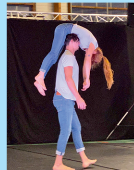
« Lance-moi en l'air » de la Compagnie L'Éolienne Cirque Chorégraphié