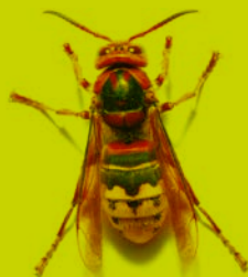
Frelon commun (jusqu'à 4 cm)