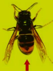
Frelon asiatique (taille réelle 3 cm)

Le frelon asiatique se nourrit d'insectes riches en protéines : la consommation d'abeilles induit des nuisances sur les ruches et la production de miel; la prédation sur les pollinisateurs peut impacter la biodiversité locale et la production fruitière.