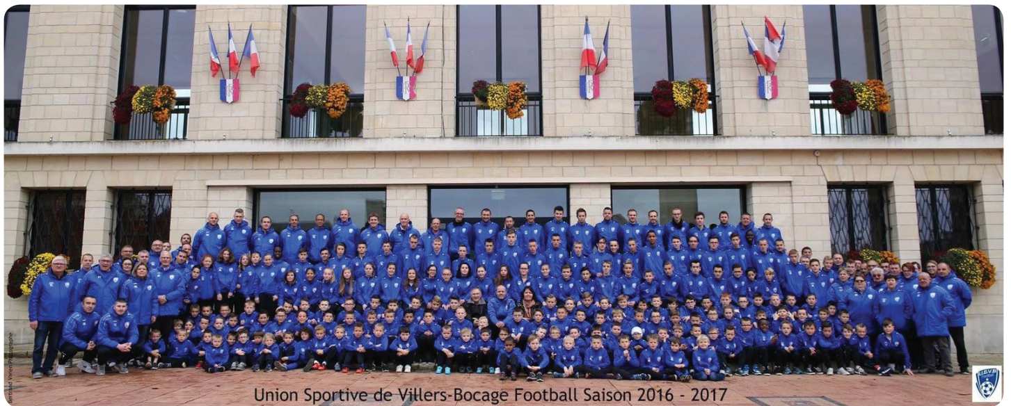
Union Sportive de Villers-Bocage Football Saison 2016 - 2017